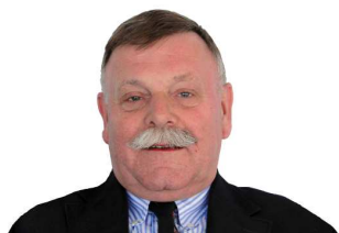
Herr Herz Verkauf Inland & Export

Tel: +49 (0) 2302 / 961 - 141 Fax: +49 (0) 2302 / 961 - 100 E-Mail: herz@eisenwerkboehmer.de