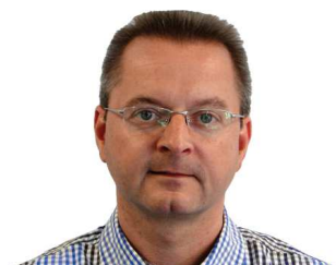
Herr Berneburg Verkauf Inland

Tel: +49 (0) 2302 / 961 - 141 Fax: +49 (0) 2302 / 961 - 100 E-Mail: herz@eisenwerkboehmer.de